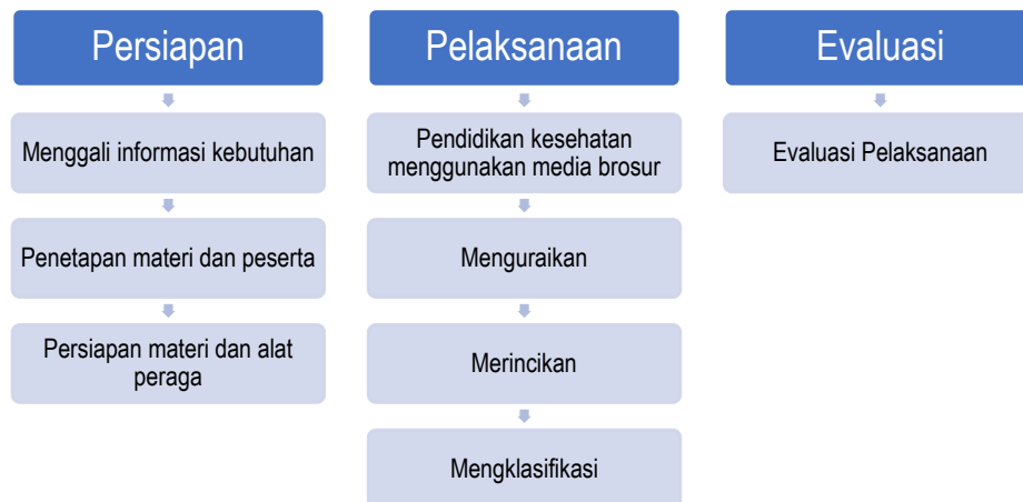
Gambar 1. Kerangka Pemecahan Masalah

Tahapan yang dilaksanakan dalam kegiatan ini adalah sebagai berikut: