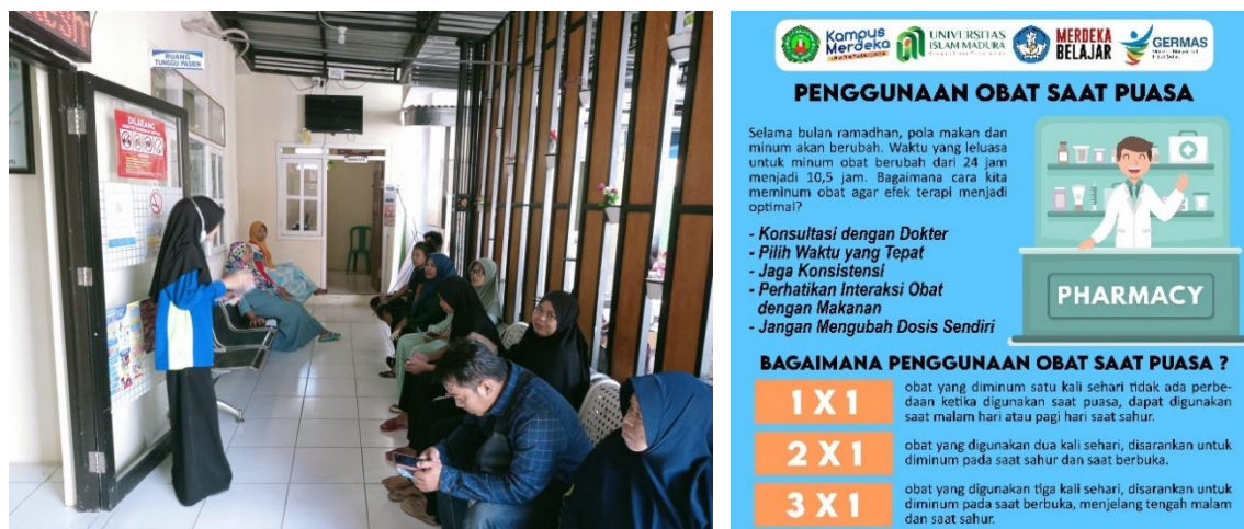
Gambar 3. Dokumentasi Pemberian Informasi Penggunaan Obat Pada Saat Puasa

Tabel 3 menunjukkan jumlah pernyataan benar dan salah untuk setiap item pernyataan di kuisioner yang telah diisi oleh responden sebelum dan sesudah edukasi. Berdasarkan table 3, frekuensi responden terkait pernyataan yang berjumlah 13 pernyataan mengalami frekuensi jawaban benar yang meningkat setelah diberikan edukasi mengenai penggunaan obat saat bulan ramadhan bagi yang berpuasa. Uji statistic dengan metode Paired Sample t test menunjukkan hasil P value < 0,05 yang artinya terdapat perbedaan yang signifikan antara pengetahuan peserta sebelum diberi edukasi dan setelah di beri edukasi.